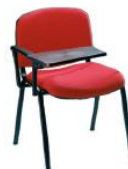
30-BP Pala escamoteable